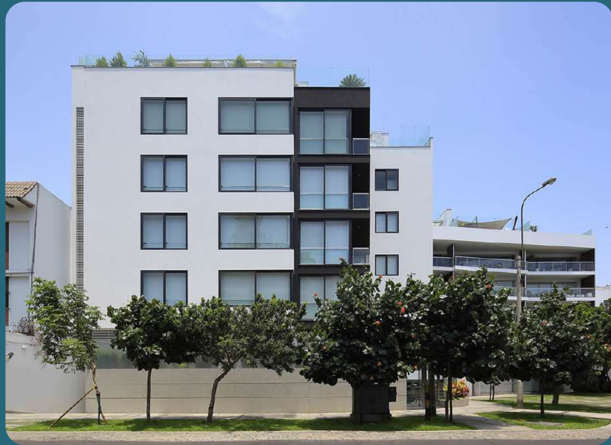
MELITÓN PORRAS 135