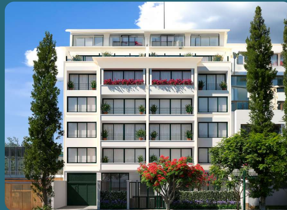
MELITÓN PORRAS 165